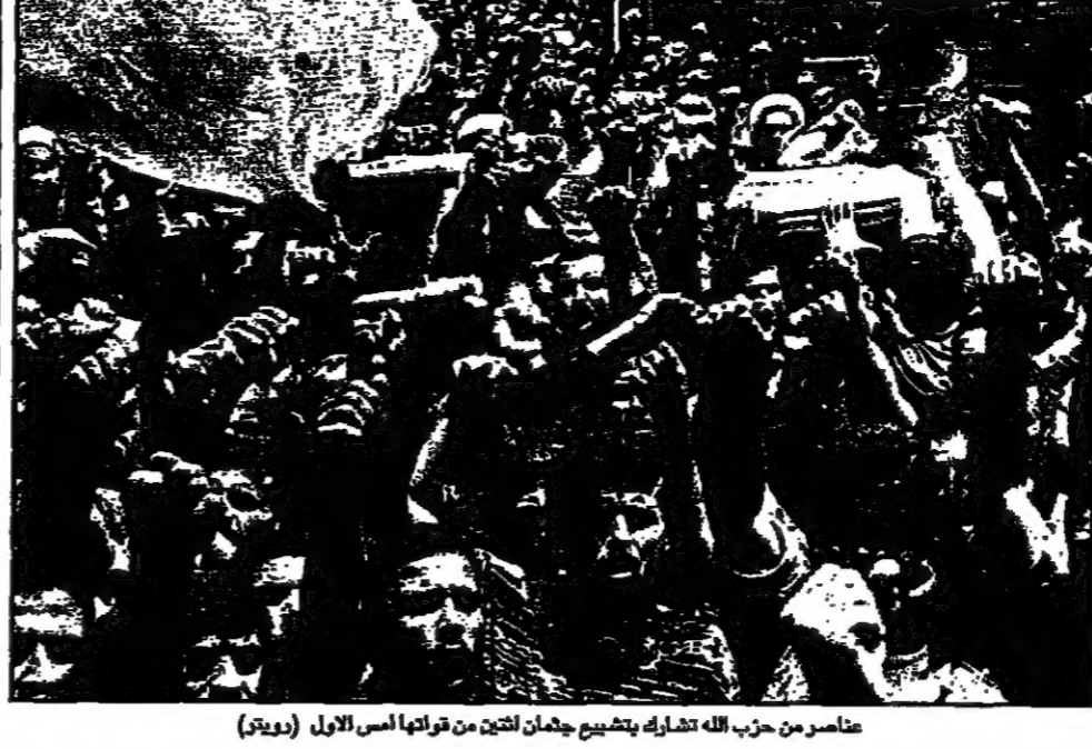
عناصر من حزب الله يتابعون جثمان اثنين من قتلها اسراييل